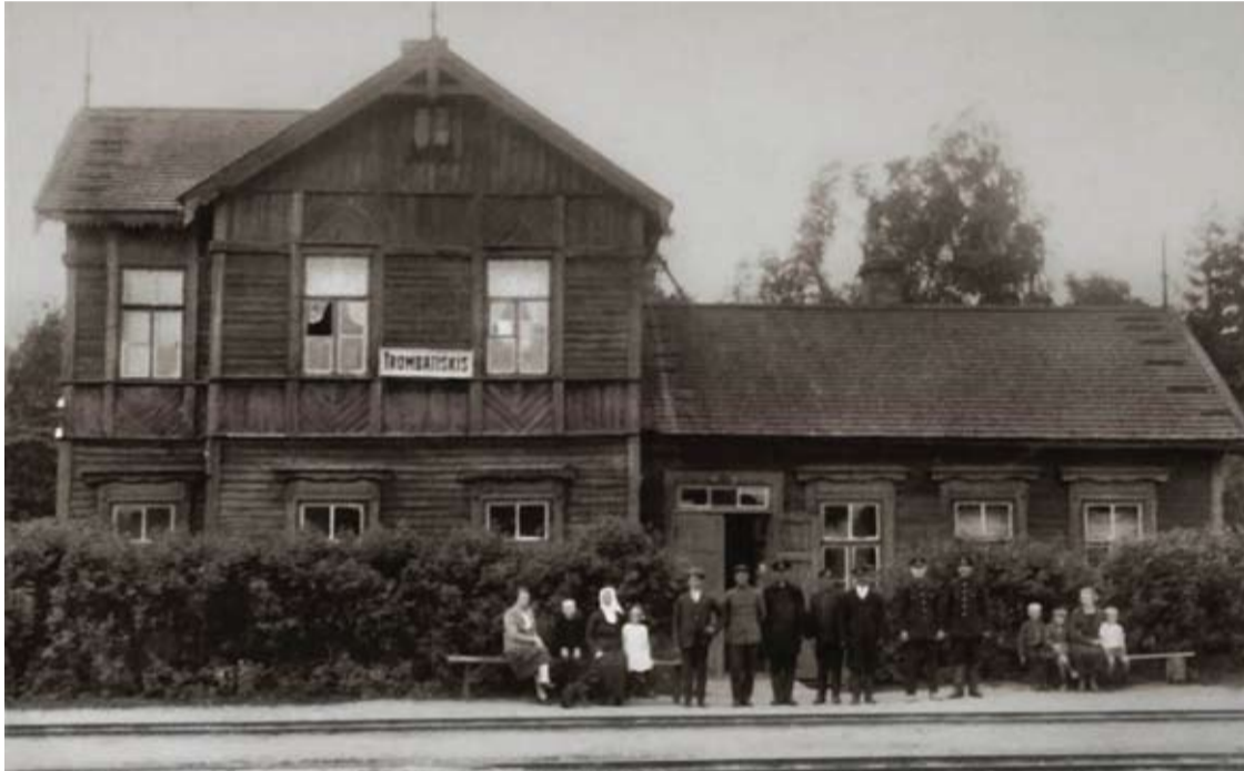
Trumbatiškio geležinkelio stotis apie 1928 – uosius metus.

Pastatyta 1899 metais, ji tarnavo iki 1983 – ujų, o prieš trejus metus, deja, nugriauta. Jos vietą žymi tik informacinė lentelė. Ant žemės stoties nė pėdsako neliko, tačiau dar yra ją ir dalį siaurojo geležinkelio epochos prisimenančių žmonių.