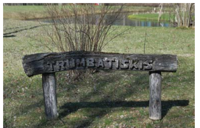
Su žeme sulygintą stoties vietą žymi informacinė lentelė, praeivį ar pravažiuojantį informuojanti apie kadaise stotyje virusį gyvenimą.