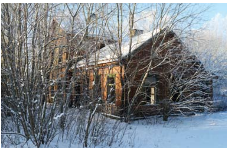
Taip Trumbatiškio geležinkelio stotis atrodė 2016 – aisiais metais.

Mano vaikystės ir jaunystės prisiminimai irgi susiję su siauruku – pėsti su draugu geležinkelio pabėgiais mindavome į Gečionių aštuonmetę mokyklą, traukinuku važinėju mokydamasis Jono Biliūno vidurinėje. Geležinkeliu į Gečionis buvo artimiausias kelias. Dažnai susitikdavome ir būdavome pakalbinti ruožą prižiūrinčių geležinkeliėčių iki vienos nelemtos jau kitoje Gečionių kaimo pusėje gyvenusių bendraklasių išdaigos. Kartais ant bėgių ir mes padėdavome kapeiką ar kokią smulkmenėlę, kurią pravažiavęs traukinys suplodavo. Trumbatiškio pusėje gyvenę vaikinukai į bėgių sandūrą įstatė bėgvinį. Tie patys ruožą prižiūrintys geležinkeliėčiai su drezina nulėkė nuo bėgių į pagelžkelės krūmus. Laimei, labai nesusižalojo. Aiškintis nevykėlių išdaigininkų į mokyklą atvažiavo milicija. Mums buvo griežtai uždrausta ne tik vaikščioti geležinkeliu, bet ir prie jo artintis. Pastebėję mus, geležinkeliėčiai jau iš tolo imdavo rėkti. Taigi, į mokyklą iš Rubikių eidavome per Gečionių mišką arba važiuodavome vieškeliu dviračiais, autobusu.