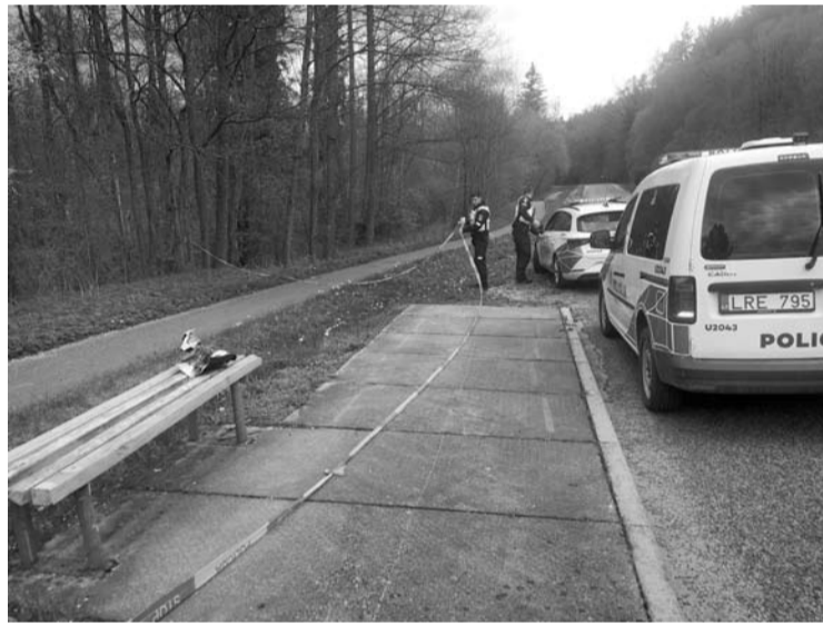
Išminuotojų laukta ilgas valandas.

Pavasaris yra savotiškas bombų rinkimo metas. Lietuvoje vis dar nemaža Antrojo pasaulinio karo sprogmenų, kurie vis iškasami per statybas ar išariami apdirbant laukus. Pasak policininkų ir išminuotojų, teko laukti ilgai dėl to, kad dabar pavasaris, todėl jie turintys daug darbo.