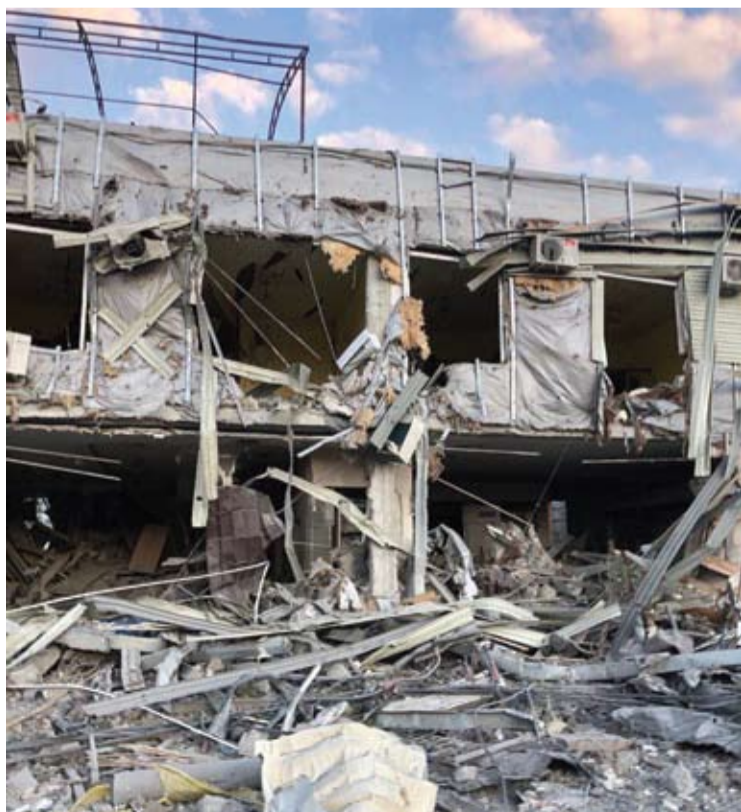
Rusijos raketų smūgiai Odesos neaplenkia.