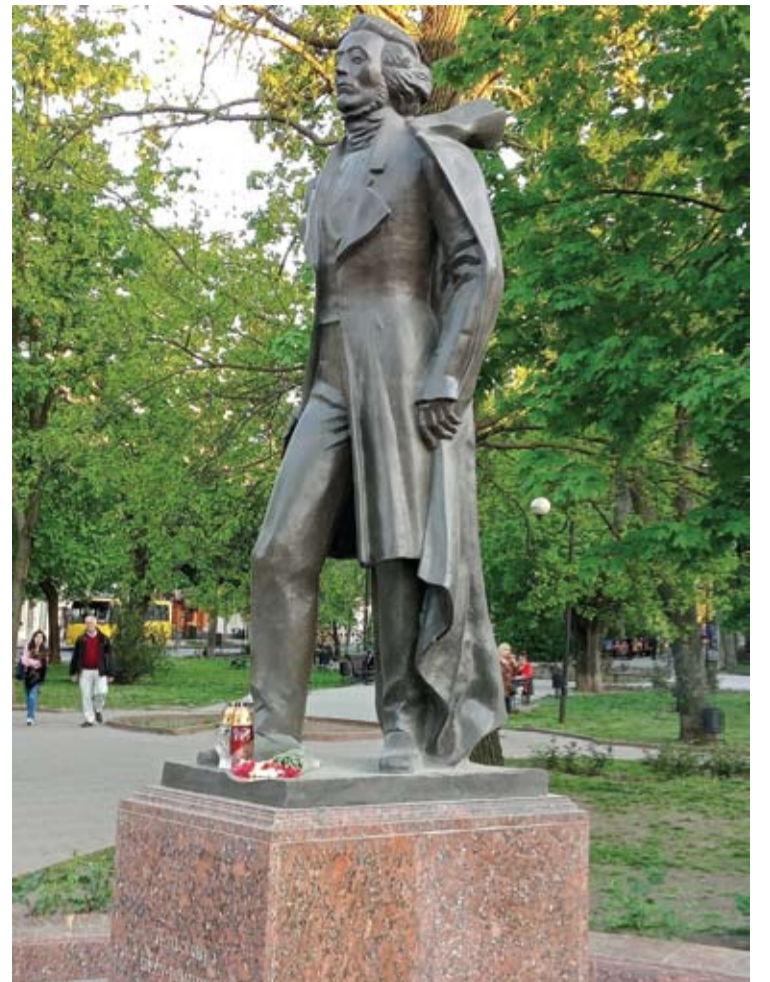
Odesoje stovi paminklas žymiajam lietuvių ir lenkų poetui Adamui Mickevičiui.