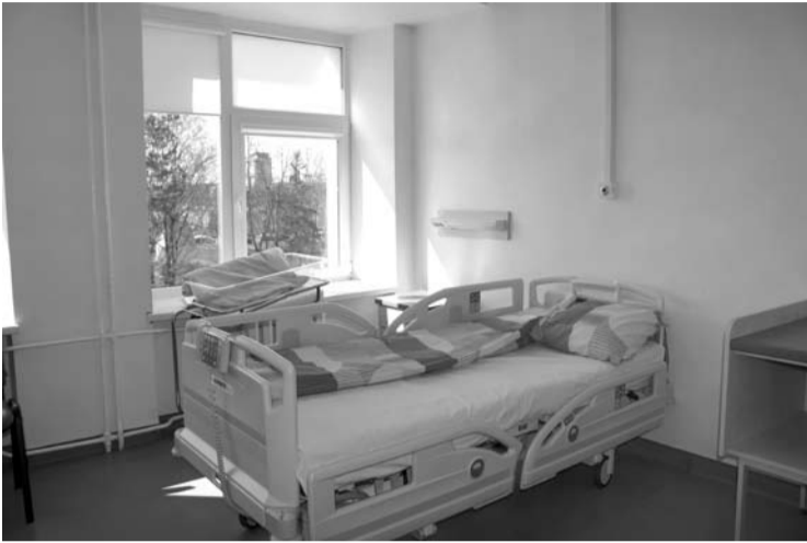
Akušerijos – ginekologijos klinikos palata.